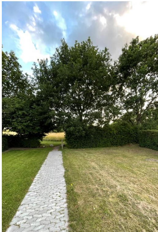
Buskads der ønskes fjernet.