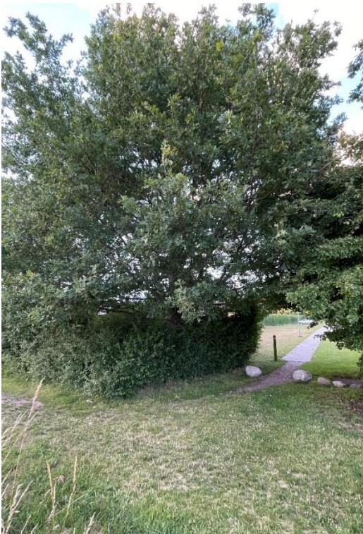
Træet der skal blive stående.